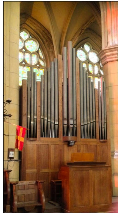
Orgue de chœur