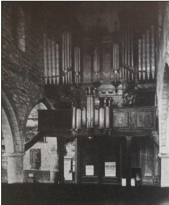
Grand orgue disparu

L'association La Boïse de Saint-Nicaïse réclame le maintien in situ de cet ensemble organistique de première importance, ainsi que sa restauration , afin qu'il soit la pièce maîtresse d'un centre organistique européen articulé à l'ensemble des instruments de la ville de Rouen et coordonné avec les classes d'orgue du conservatoire tout proche et des écoles de musique.