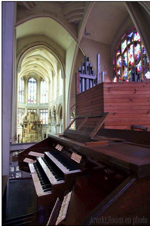
Grand orgue actuel depuis la tribune, photo © Aïtel Arezki